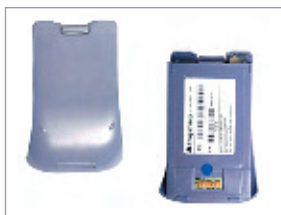
Leistungsstarker Li-Ion Akku