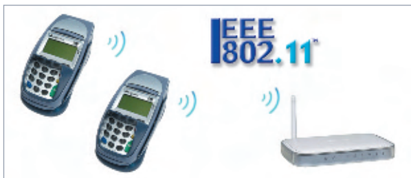
Mehrere Terminals i7810 können an einem Router betrieben werden.

Ein Vorteil ist, dass ohne weiteren Aufwand auch mehrere Terminals in einem Netzwerk betrieben werden können.