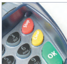
Tastatur mit ergonomischem Sichtschutz und taktilen Symbolen